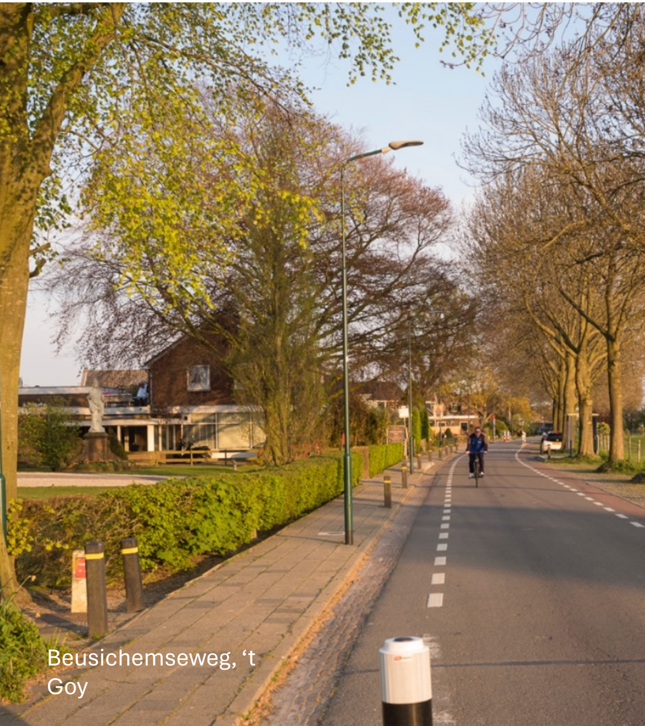
Beusichemseweg, 't Goy